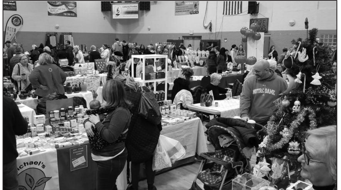
Bendras mugės vaizdas Ritos Riškų salėje.