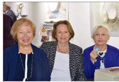
„Saulutės“ narės parduoda bilietus į koncertą.