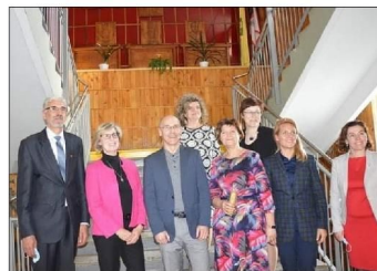
Mosėdžio gimnazijos ypatingos klasės atidarymas